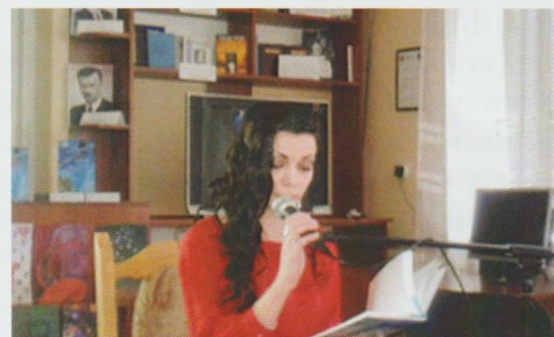
Презентація поетичної збірки “Без гравітації”. Виноградівська ЦРБ