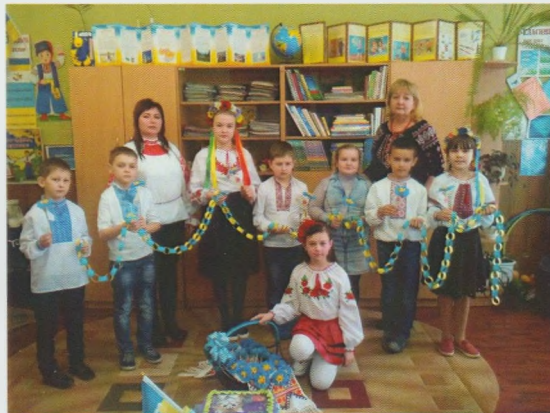
Поетично-пізнавальне свято "Найкраща мова єднання – українська". Великоберезнянська РДБ