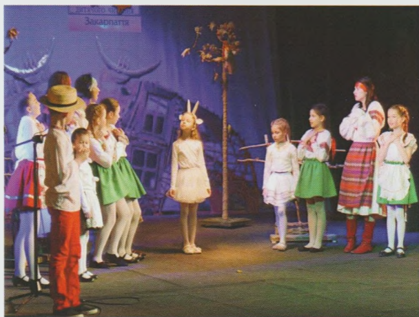
Урочисте відкриття Всеукраїнського тижня дитячого читання "З книгою у майбутнє!". Закарпатська ОДЮБ