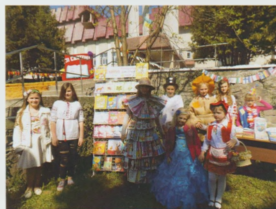
Театралізована концертно-ігрова програма "У казковому світі мудрої книги". Перечинська РДБ