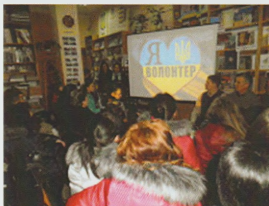
Молодіжний загін волонтерів "Милосердя", Хустська РБ