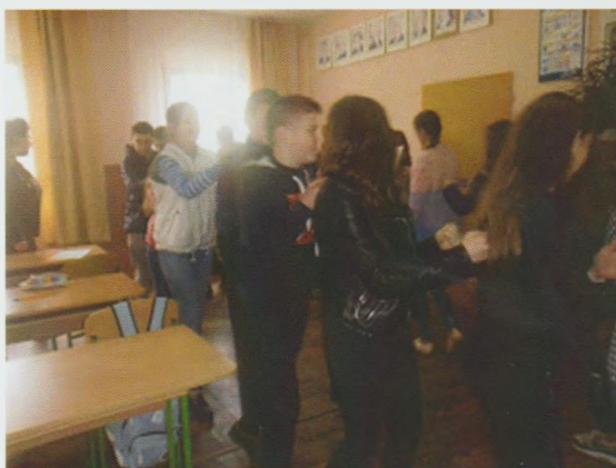
Тренінг “Ми проти паління!”. Воловецька РБ

У Виноградівській районній бібліотеці з успіхом відбулася презентація поетичної збірки “Без