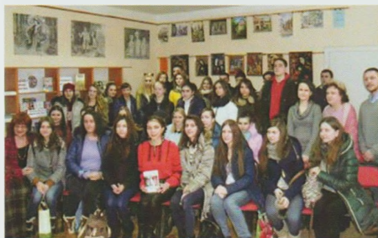
Презентація книги "Не зрадь!". Закарпатська ОДЮБ

До Дня захисника України і Дня українського козацтва в бібліотеках-філіях Рахівської ЦБС та у Воловецькій районній бібліотеці успішно від-