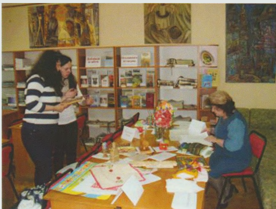
Обласний етап Всеукраїнського конкурсу молодіжної творчості “Наша спадщина”, Закарпатська ОДЮБ