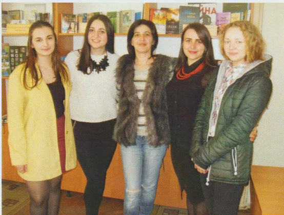
Літературно-поетичний вечір “ЗвиЧАЙна, вільна поезія”, Ужгородська ЦМБ