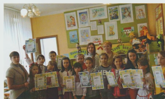
Конкурс поетичного слова "Поетія – мелодія душі". Рахівська РДБ

відали віршики і отримували кульки та солодощі. Також у міському парку для малечі провели міні-фізкультурзмагання "Нам пігулки і мікстуру заміняє фізкультура". Із задоволенням діти брали участь у всіх іграх, запропонованих бібліотекарями – це саме те, що їм дуже подобається та приносить величезне задоволення.