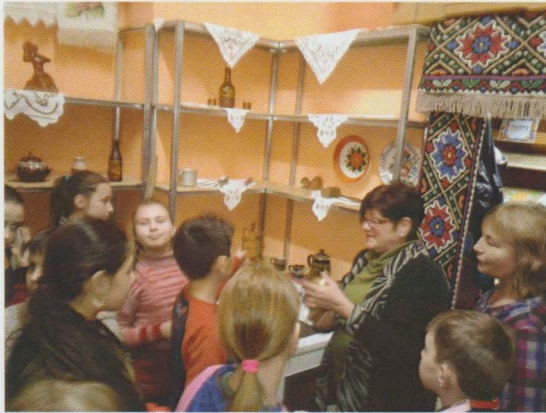
Музейна кімната "Дивні речі для малечі". Хустська РДБ