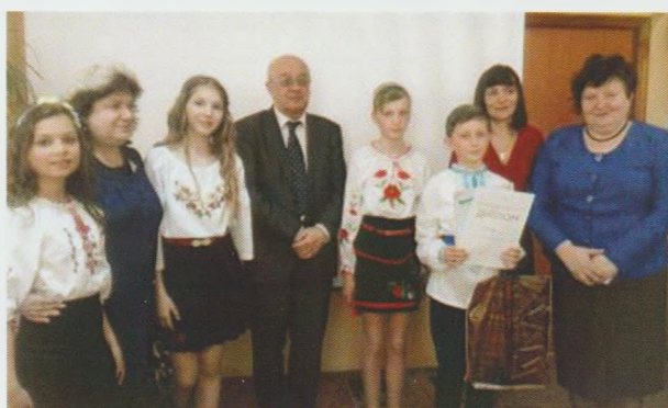
Переможці обласного туру Всеукраїнського конкурсу дитячого читання "Книгоманія-2017". Закарпатська ОДЮБ

заходами для дітей відбулося засідання за круглим столом "Підтримка і розвиток дитячого читання в Україні: загальнонаціональні ідеї та регіональний досвід" за участі фахівців НБУ для дітей, бібліотекарів спеціалізованих бібліотек для дітей Закарпаття, видавців, дитячих письменників, представників влади.