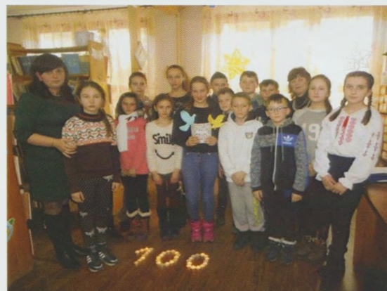
Година пам'яті "Пам'ятаємо героїв Майдану". Воловецька РДБ