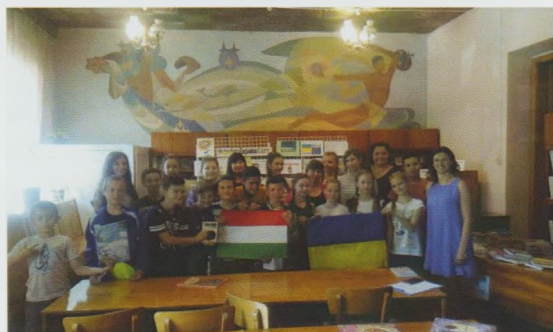
Book пілігрім "Разом з книгою по Європі". Мукачівська МДБ