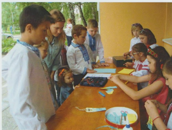
"Ярмарок патріотичних ідей". Ужгородська МДБ