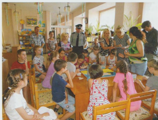
Пазл-карта "Схід і Захід разом". Бібліотека- філія № 2 Ужгородської МЦБС