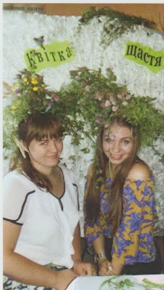
Етно-панорама “Квітка щастя”. Іршавська ЦРБ

булися вечори-зустрічі “Героям Слава!” та “Війна очима захисників України”. Участь в заходах взяли учнівська молодь селищ, прикордонники КПП “Великий Бичків” та воїни АТО, які понад рік обороняють кордони нашої держави в Донецькій області. З боєм в голосі розповіли молоді правду про жорстоку реальність неоголошеної війни на Сході, про буденне життя своїх побратимів. А юнаки та дівчата з смт Великий Бичків, на запрошення прикордонників із задоволенням завітали на територію прикордонної частини.