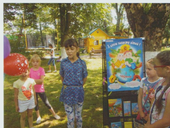
Вулична акція "Міняю кульку на віршик". Іршавська РДБ