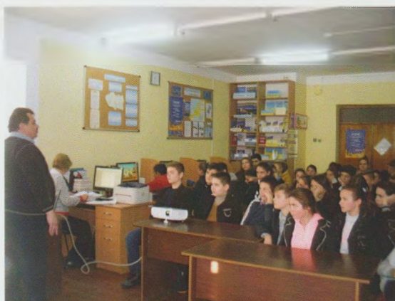
Правознавчий турнір “Уроки права – уроки життя”. Перечинська ЦРБ