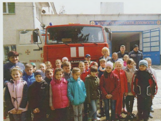
Експерсію до державної пожежно-рятувальної частини-6 "Герой – рятувальник завжди поруч!". Виноградівська РДБ

студенти 1-го та 3-го курсів спеціальностей "Інформаційна, бібліотечна та архівна справа" та "Бібліотечна справа" Ужгородського коледжу культури і мистецтв. Студенти змогли передати емоційну мозаїку кожного віршика, і присутні легко впізнавали куточки рідного міста, про які так тепло написала поетеса.