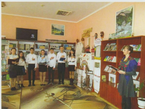
Вечір-реквієм “Велич і трагедія Карпатської України”. Тячівська ЦРБ