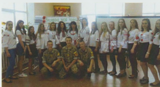
Молодіжна тусівка "Вишивана моя Україна". Мукачівська ЦМБ