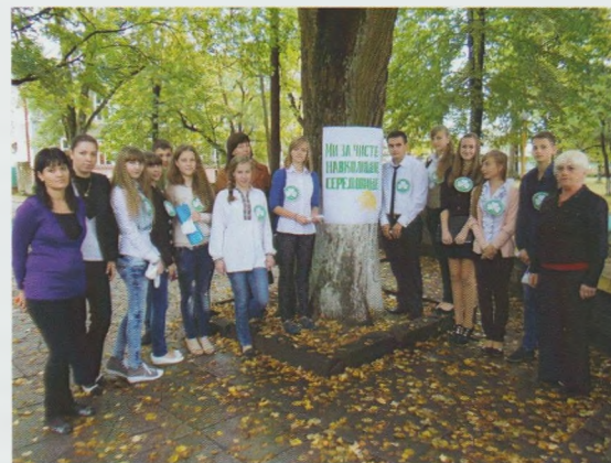
Екологічний екстрим “Екологія сьогодні – наше майбутнє!”. Великоберезнянська ЦРБ