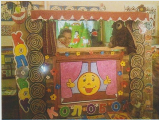
Міні-вистава "Колобок" Берегівська РДБ