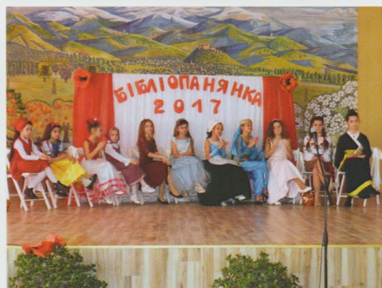
Літературно-музичний батл "Бібліопанянка-2017". Мукачівська РДБ