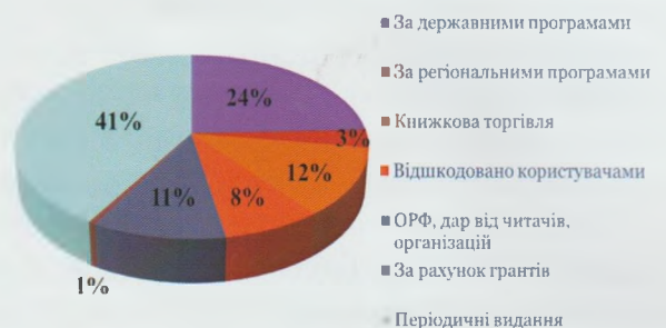
Джерела надходжень видань для дітей до бібліотек області в 2017 р.

Поповнення фондів здійснювалось в основному за рахунок державних програм – 5,9 тис. прим., за регіональними програмами – 0,8 тис.