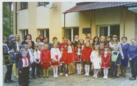
Літературно-музична композиція "Наймиліша, найрідніша, матінко моя". Міжгірська РДБ