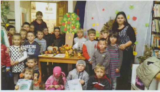
Майстер-клас "Дари осені". Ужгородська ЦРБ