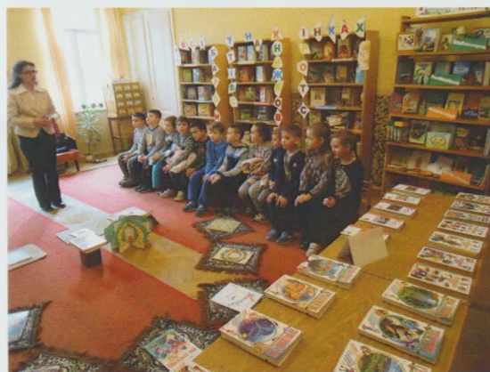
"День книжкових сюрпризів". Виноградівська РДБ