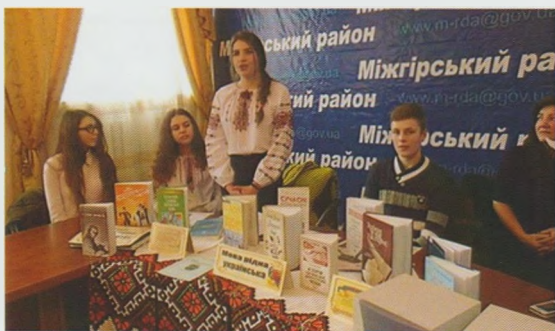
“Українська мова – вчора, сьогодні, завтра...” Міжгірська ЦРБ