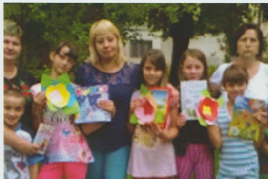
Екологічна гра "На лісовій галявині". Свалявська РДБ