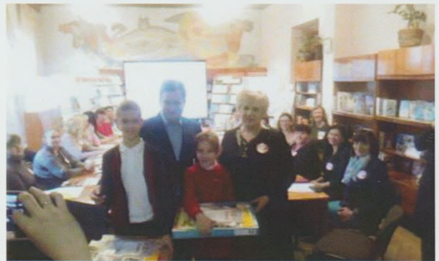
Переможці Всеукраїнського конкурсу дитячого малюнку Рідна країна – безпечна країна "Як треба поводитися на дорогах!". Закарпатська ОДЮБ

Зі сцени Закарпатського академічного обласного театру ляльок Алла Гордієнко, генеральний директор НБУ для дітей, заслужений працівник культури України, президент Української асоціації працівників бібліотек для дітей привітала присутніх з книжковими іменинами і зачитала лист-вітання Міністра культури України Євгена Нищука. Відбулося нагородження грамотами та подяками Міністерства культури України, Президії Української асоціації працівників бібліотек для дітей, НБУ для дітей керівників галузі культури області, кращих працівників дитячих книго-