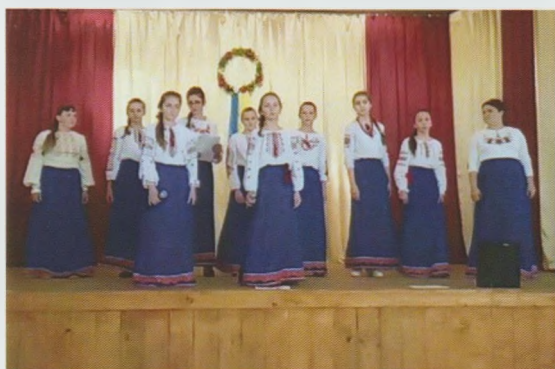
Літературно-музичний вечір “Найкраща країна – моя Україна”. Берегівська ЦБС