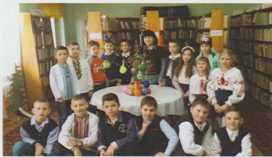
Конкурс "Великодня писанка". Чопська МДБ

ки було запропоновано переглянути добірку літератури "Красуня осінь в гості завітала". Учні з великим задоволенням відгадували загадки та читали вірші про осінь. Пройшов майстер-клас "Дари осені", де діти створювали шедеври у поробках з природного матеріалу, аплікації, композиції, в які вклали всю свою фантазію і гарний настрій.