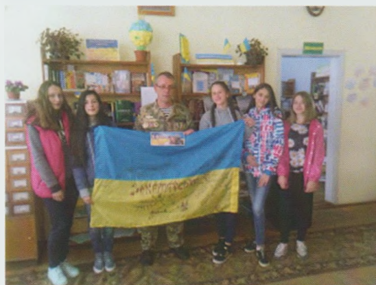
Зустрічі з війнами АТО. Рахівська ЦРБ, Воловецька РБ