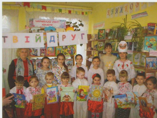
Літературне свято "Книжка – добрий, мудрий друг". Бібліотека-філія для дітей смт Королево Виноградівської ЦБС

Працівники Іршавської районної бібліотеки для дітей провели вуличну акцію "Міняю кульку на віршик". З великим задоволенням діти розпо-